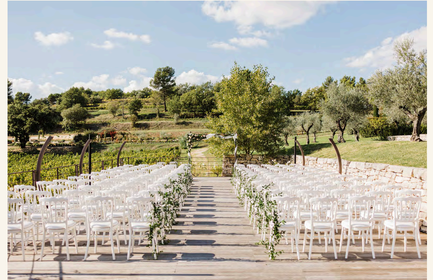
LE SUNSET LOUNGE