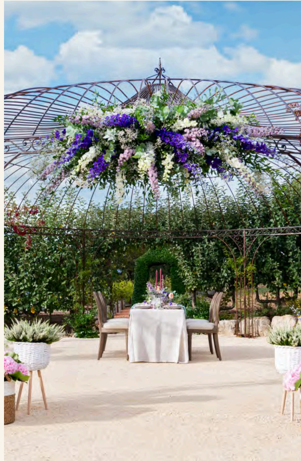
LA GLORIETTE ET SON POTAGER