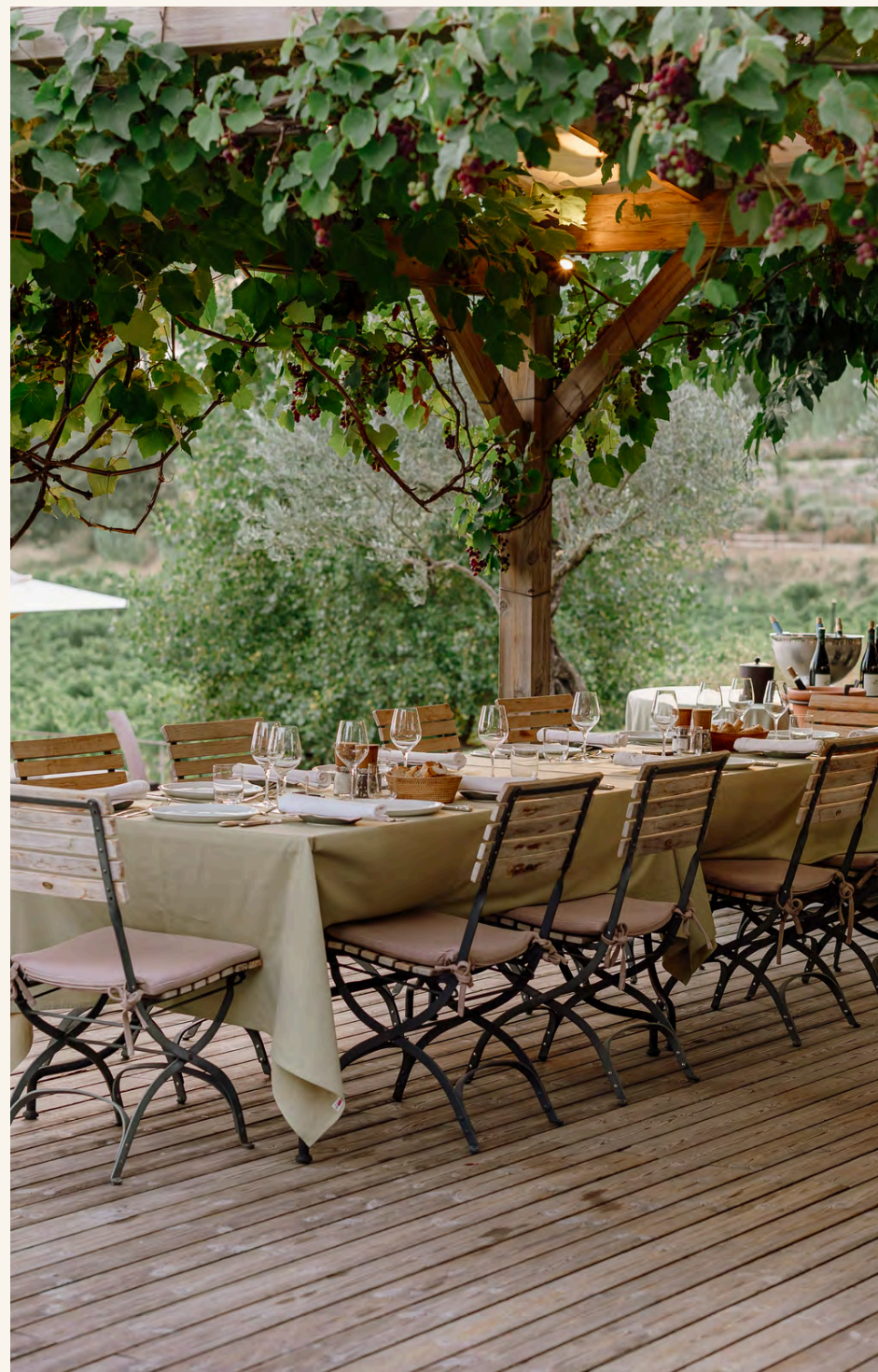
JARDIN DANS LES VIGNES